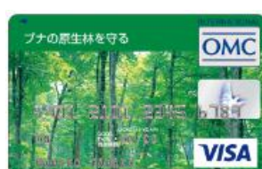
ブナの原生林を守る