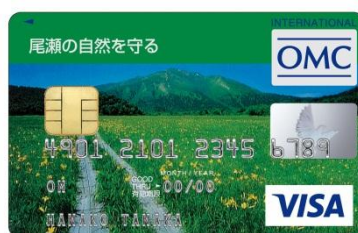
尾瀬の自然を守る