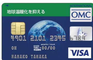
地球温暖化を抑える