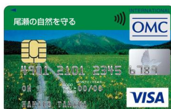
尾瀬の自然を守る