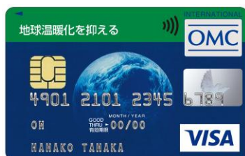
地球温暖化を抑える